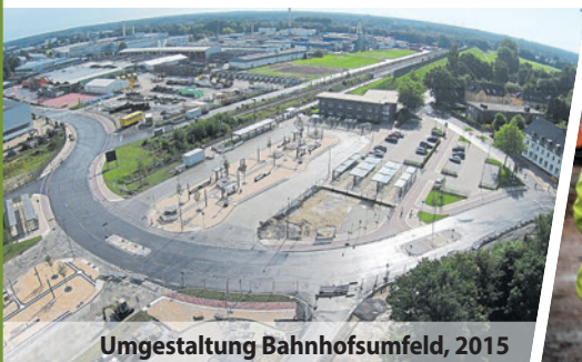
Umgestaltung Bahnhofsumfeld, 2015