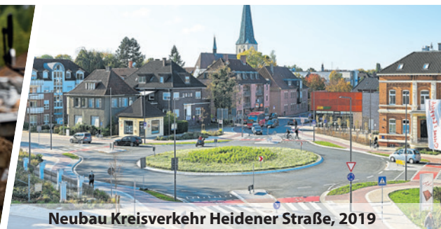
Neubau Kreisverkehr Heidener Straße, 2019